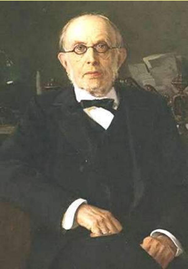
Константин Петрович Победоносцев