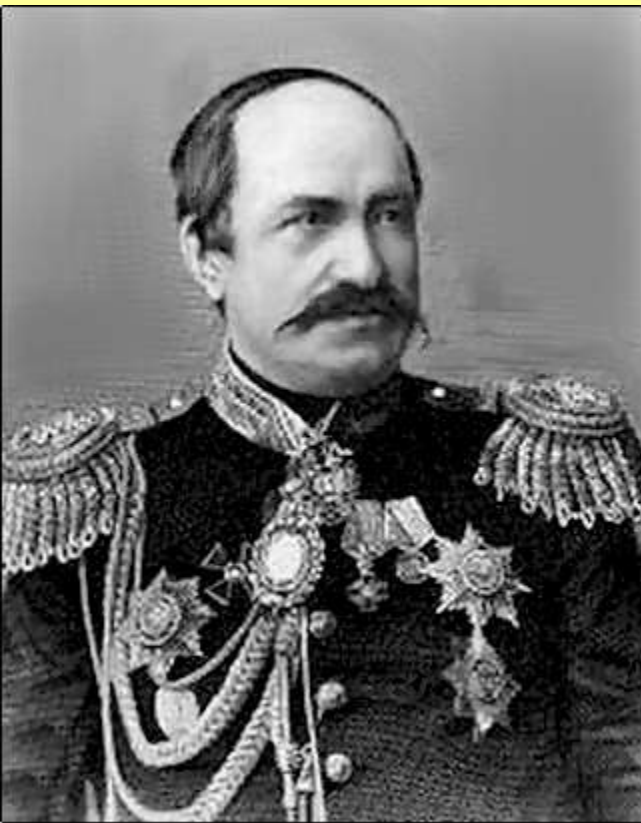
Николай Павлович Игнатьев (1832–1908).

В мае 1881 г. после издания манифеста «О незыблемости самодержавия»