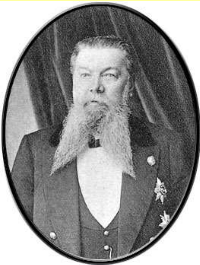
Иван Николаевич Дурново