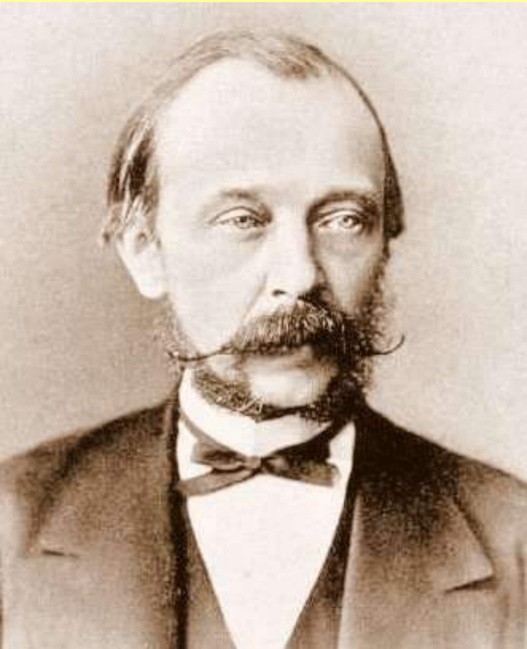
Граф Дмитрий Андреевич Толстой (1823–1889), министр внутренних дел в 1882–1889 гг.

В мае 1882 г. МВД возглавил Д.А. Толстой, бывший министр просвещения.