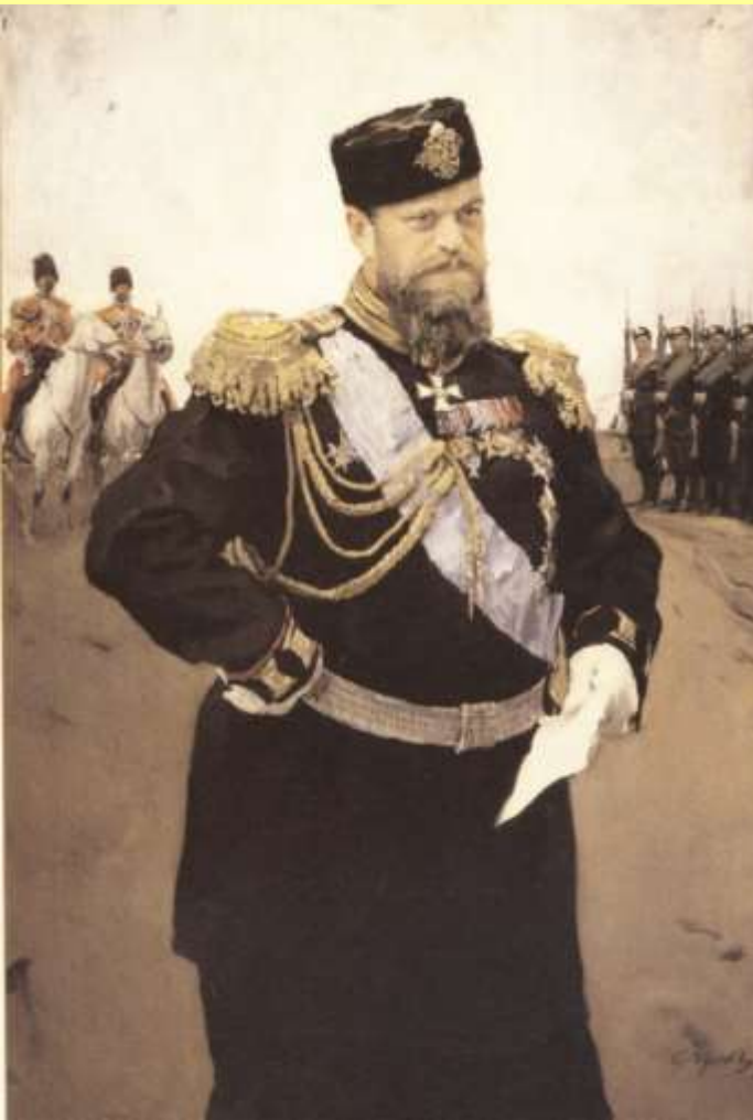
Портрет Александра III с рапортом в руках. Худ. В. Серов.