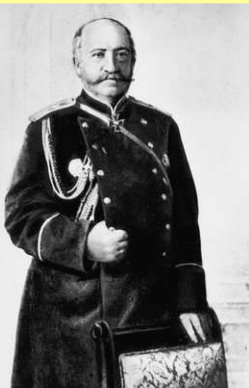
Николай Павлович Игнатьев.

Игнатьев хранил проект в тайне от других министров и собственных сотрудников, всецело полагаясь на славянофильские симпатии Александра III.