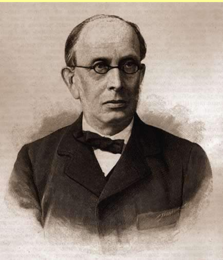
Константин Петрович Победоносцев (1827 – 1907), обер-прокурор Св. Синода.

Огромным влиянием на Александра III пользовался его воспитатель, обер-прокурор Св. Синода К.П. Победоносцев.