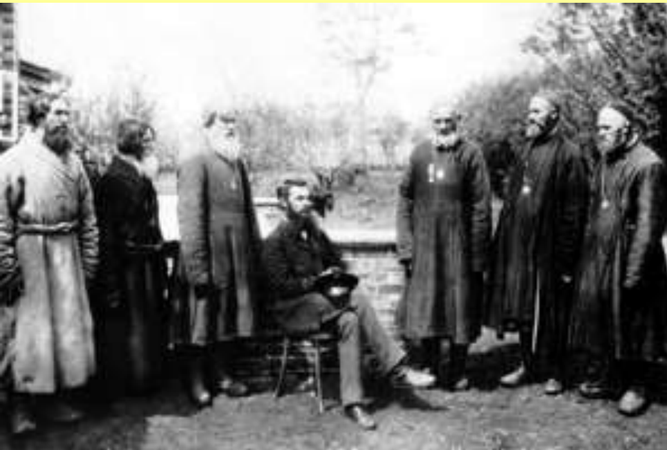
Волостные старшины у земского начальника. Нижегородская губерния, 1891 г.

Земский начальник назначал членов волостных правлений из предложенных крестьянами кандидатов, мог отменять решения волостных судов, штрафовать крестьян и арестовывать на срок до 7 дней.