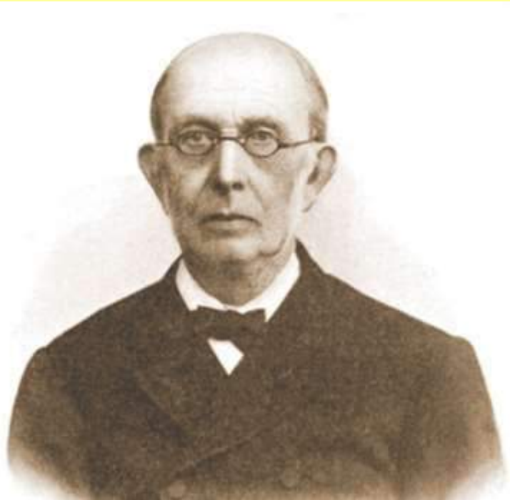
Константин Петрович Победоносцев

Из статьи Победоносцева «Великая ложь нашего времени»: