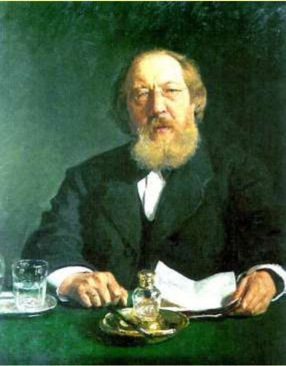
Иван Сергеевич Аксаков (1823–1886).

Под влиянием московских славянофилов во главе с И.С. Аксаковым Н.П. Игнатьев предложил созвать Земский собор (3 тыс. депутатов от дворян и горожан на основе имущественного ценза, 1 тыс. – от крестьян).