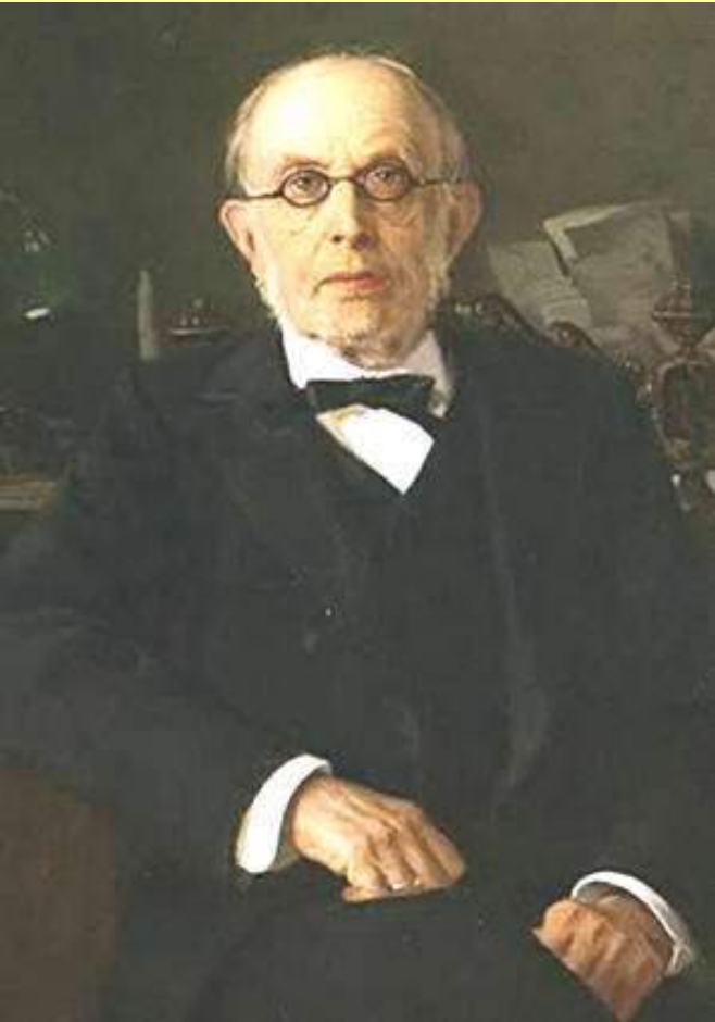
Константин Петрович Победоносцев