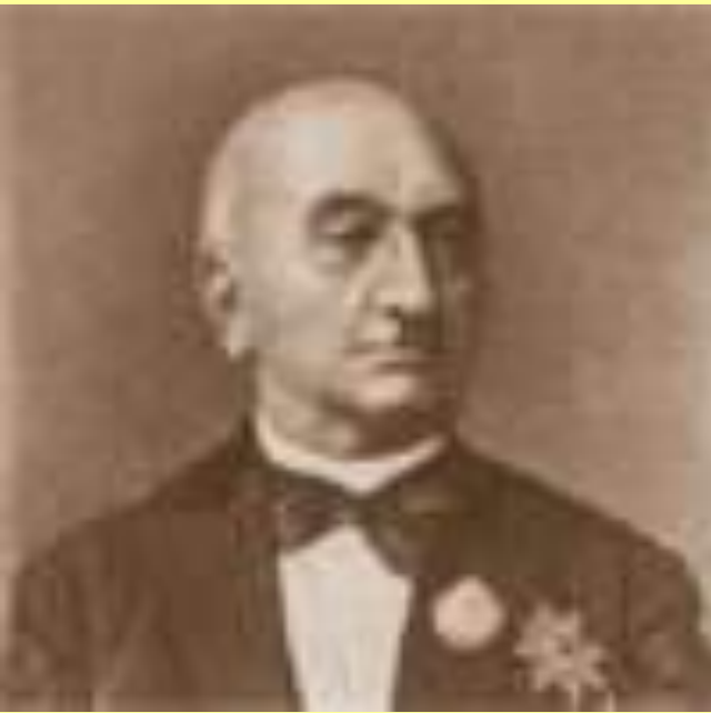
Иван Давидович Делянов (1818–1897), министр просвещения в 1882–1897 гг.

В 1887 г. Делянов издал доклад «О сокращении гимназического образования», повысив оплату за обучение в гимназиях и прогимназиях. Не рекомендовалось принимать «детей кучеров, лакеев, поваров, прачек, мелких лавочников и тому подобных людей, детей коих, за исключением разве одаренных необыкновенными способностями, вовсе не следует выводить из среды, к коей они принадлежат, и чрез то... приводить их к озлоблению против неравенства имущественных положений»