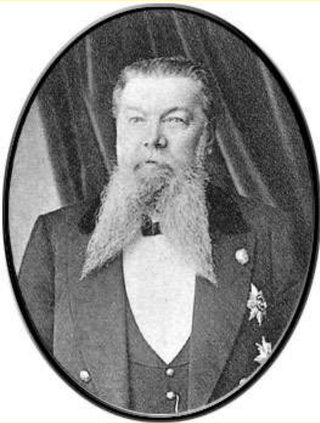
Иван Николаевич Дурново (1834–1903),