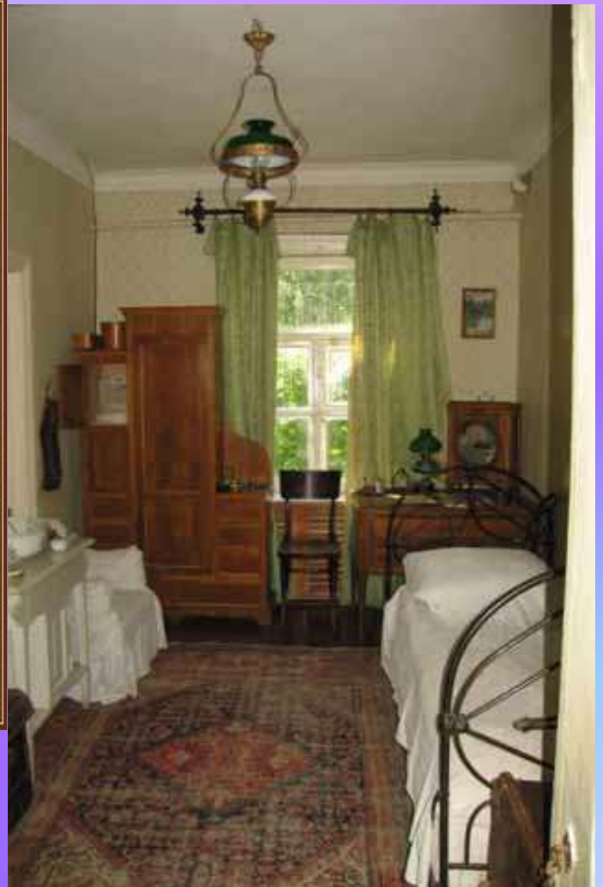
МУЗЕЙ ЧЕХОВА В МЕЛИХОВЕ