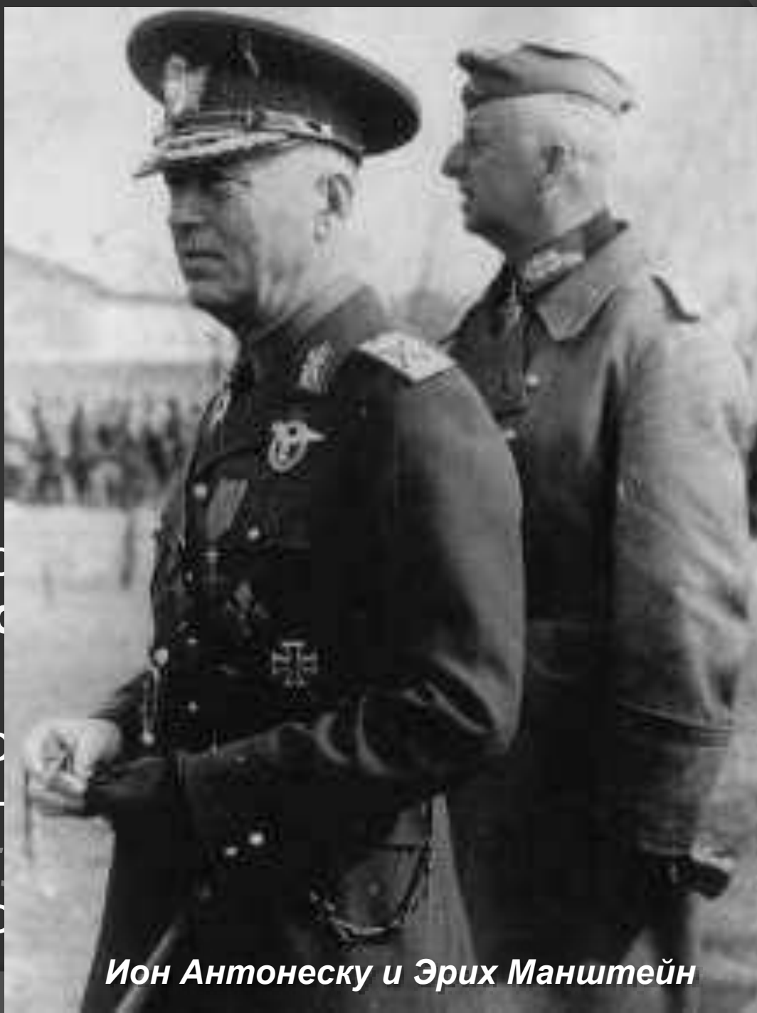
Ион Антонеску и Эрих Манштейн